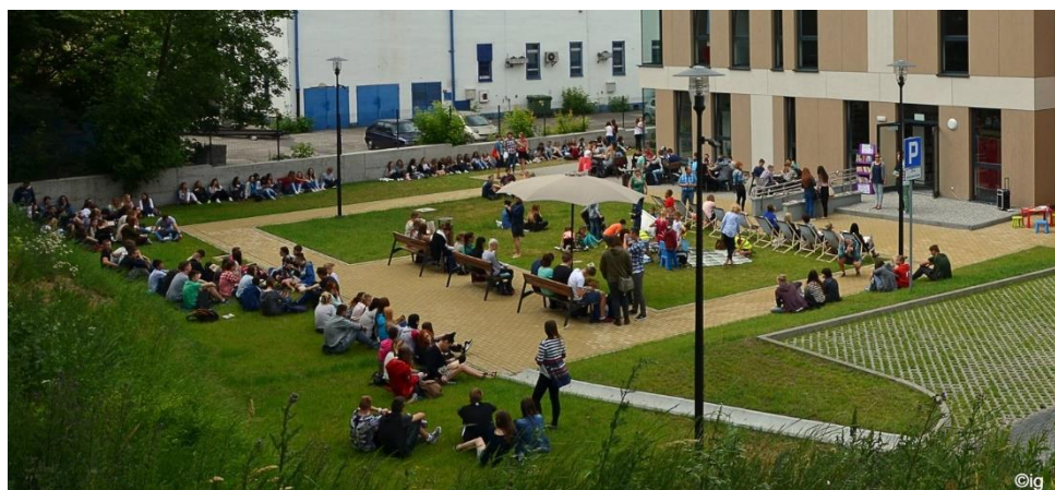
Bicie rekordu czytania w jednym momencie w Letniej Czytelnii

Nowy budynek siedziby głównej biblioteki to 1009 m 2 przestrzeni zaprojektowanej przede wszystkim z myślą o użytkownikach, zarówno czytelnikach, jak i pracownikach biblioteki: na parterze mieści się wypożyczalnia dla dorosłych, czytelnia i dział gromadzenia i opracowania zbiorów, na piętrze znajduje się oddział dla dzieci z miejscem do zabaw, sala konferencyjna i pomieszczenia administracyjne. Biblioteka, oprócz tradycyjnych zbiorów, oferuje też dostęp do internetu, możliwość skorzystania z komputerów, drukarek kserokopiarek, a także letnią czytelną z leżakami i stolikami, mieszczącą się na tyłach budynku na terenie zielonym należącym do biblioteki. Budynek jest dostosowany do potrzeb osób niepełnosprawnych (podjazd dla wózków, winda, toalety dla niepełnosprawnych) i wyposażony w system monitoringu i system alarmowy. Biblioteka dysponuje 30 miejscami parkingowymi wykorzystywanymi zarówno przez użytkowników biblioteki, jak i mieszkańców Świecia czy osoby przyjezdne.