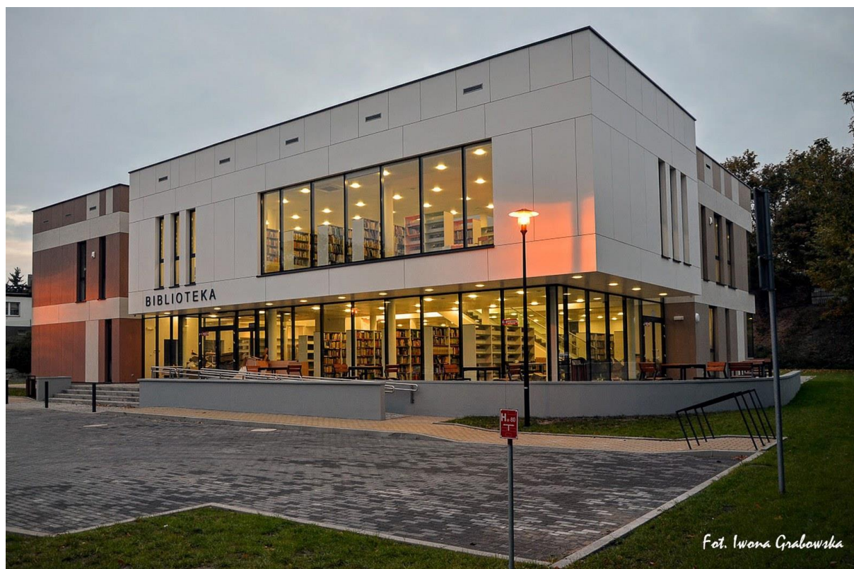
siedziba główna Miejskiej Biblioteki Publicznej w Świeciu