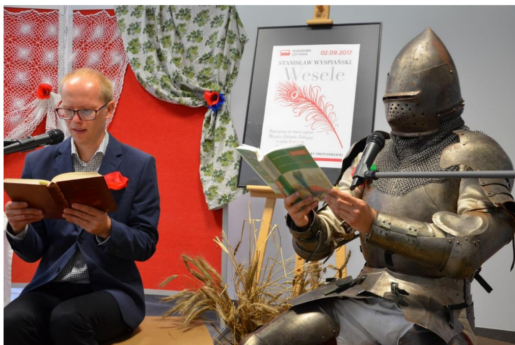
Narodowe Czytanie „Wesela” Stanisława Wyspiańskiego

Prowadzenie działalności kulturalnej i edukacyjnej promującej książki i bibliotekę w środowisku lokalnym poprzez organizację spotkań autorskich, wystaw tematycznych, konkursów czytelniczych. Działanie odpowiada na potrzebę poczucia tożsamości i wspólnoty z mieszkańcami gminy, na potrzebę samorealizacji i aktywności społecznej. Odpowiedzialny za realizację tego zadania będzie zespół pracowników biblioteki, któremu konieczne będą odpowiednie środki finansowe na zakup materiałów do organizacji wystaw, konkursów, spotkań, na honoraria dla autorów i nagrody dla uczestników konkursów. Rezultatem zadania będzie szeroka oferta działań bibliotecznych, łatwy i powszechny dostęp do szeroko rozumianej kultury i rozrywki, przede wszystkim czytelniczej.