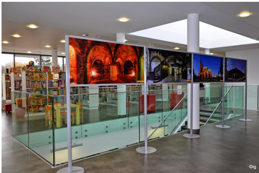
Wystawa Marka Czarneckiego „Przestrzenie Kujawsko-Pomorskie 3D”