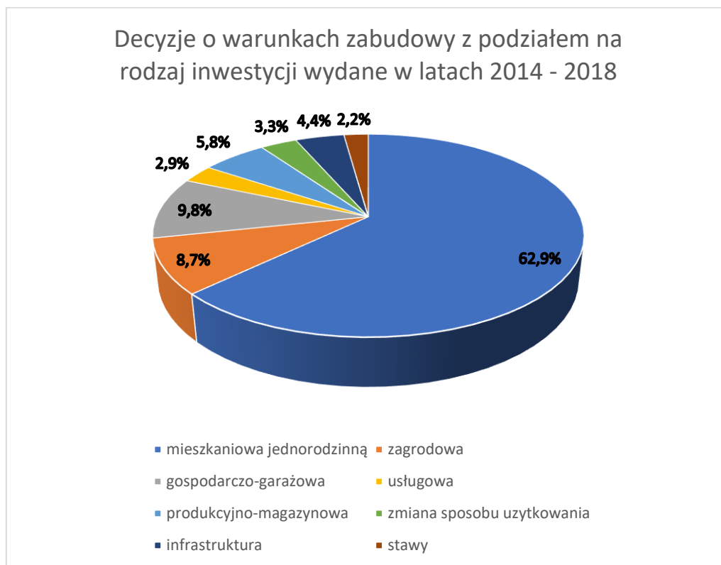
Wykres 3. Procentowy udział decyzji o warunkach zabudowy w podziale na rodzaj inwestycji w latach 2014-2018 (do 30.06.2018 r.).